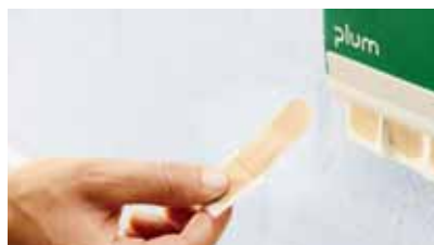
Izvadite flaster iz dozera. On je odmah spreman za korištenje...

Manje nezgode se svaki dan mogu dogoditi i na radnom mestu. Kod sitnih povreda dovoljan je i jedan flaster. Izaberite flaster koji odgovara vašem radnom mestu – ili njegovu odgovarajuću kombinaciju! Nudimo rešenja za radnike osnovna ili vlažna poslovna okruženja, ali čak i za prehrambenu industriju. Ne gubite vreme: izvadite flaster iz dozera, nalepite ga i već možete nastaviti sa radom! QuickFix brzo, higijenski i efikasno rešava problem.