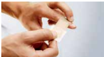
...i lako se može nalepiti i jednom rukom.